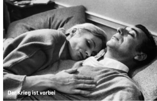
Der Krieg ist vorbei