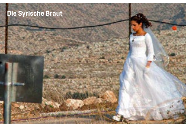
Die Syrische Braut