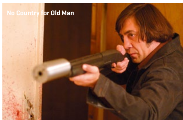
No Country for Old Man