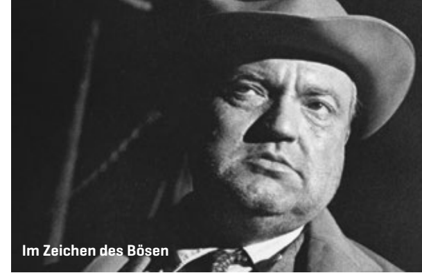
Im Zeichen des Bösen