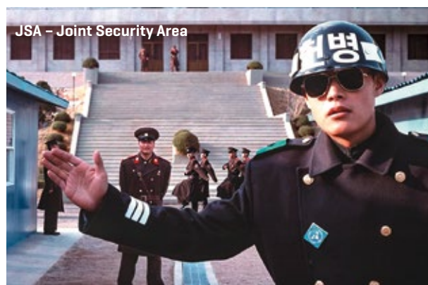
JSA – Joint Security Area