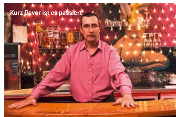
Kurz Davor ist es passiert