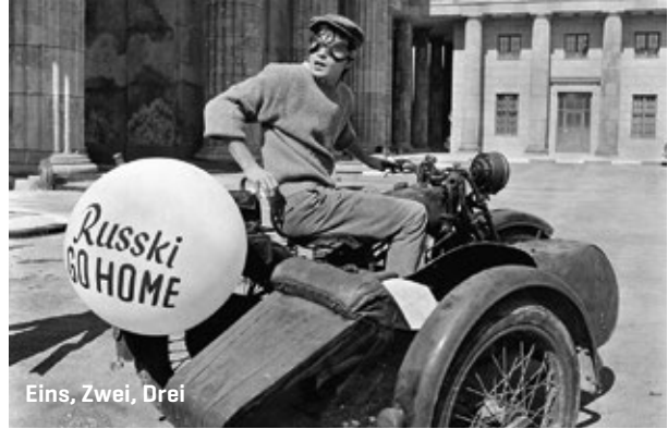
Eins, Zwei, Drei